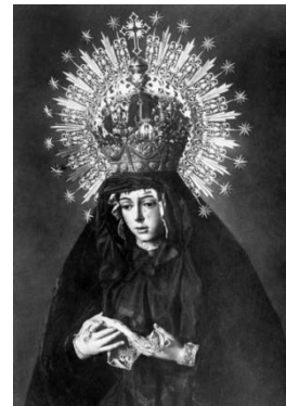
Macarena en deuil en 1920

Pour rappel bien sûr les arènes de Séville s'appellent La Maestranza